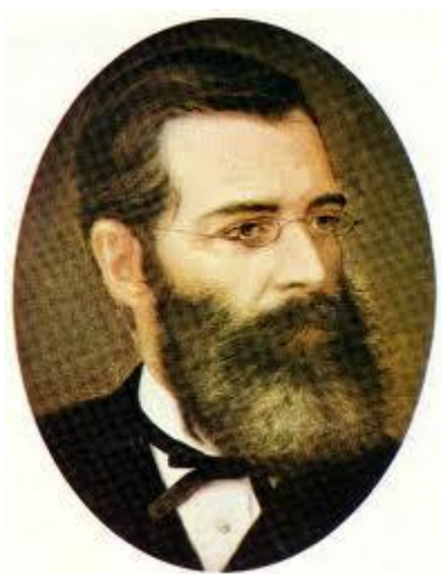
José de Alencar, um dos principais expoentes do indianismo