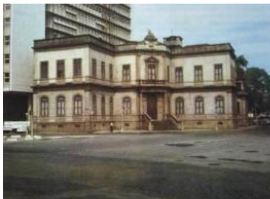
Prédio do antigo Instituto Histórico e Geográfico Brasileiro (IHGB)