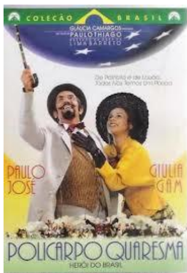
Capa do filme Policarpo Quaresma herói do Brasil , baseado em Triste Fim de Policarpo Quaresma