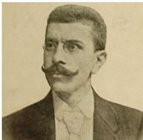
Coelho Neto, um dos principais alvos da crítica intelectual de Lima Barreto