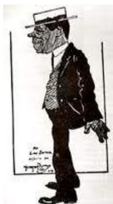
Caricatura de Lima Barreto