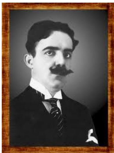
Afrânio Peixoto, um dos principais alvos da crítica intelectual de Lima Barreto