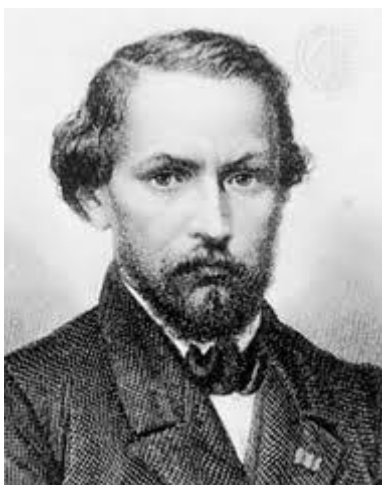
Gonçalves Dias, um dos principais expoentes do indianismo