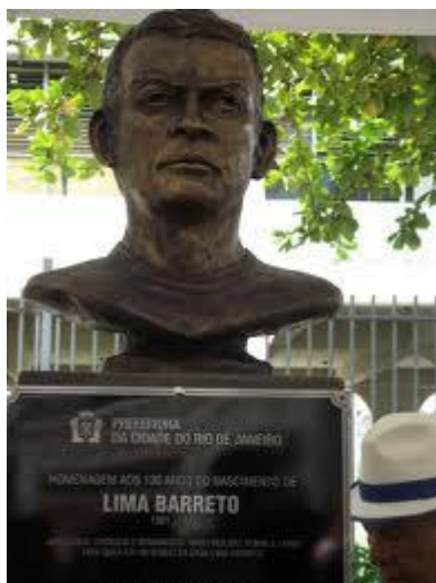
Busto de Lima Barreto no Rio de Janeiro