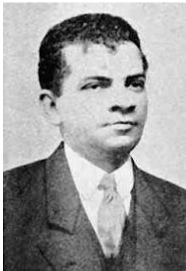
Lima Barreto no auge de sua Carreira