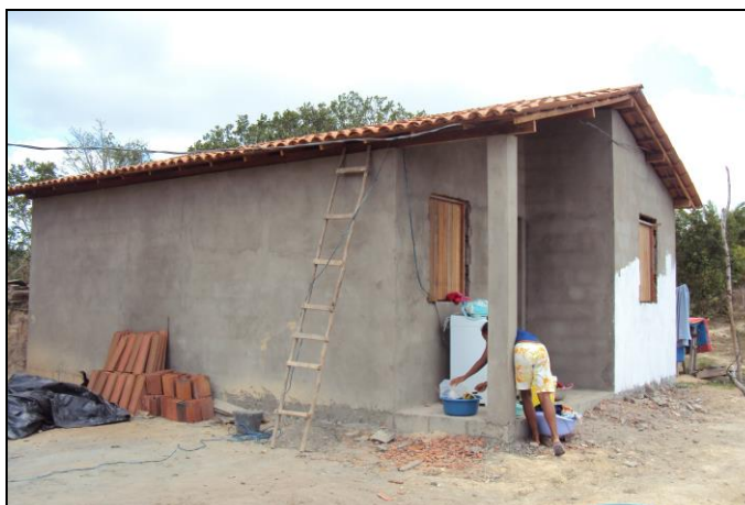
Foto 2: Unidade habitacional Girau Grande – após intervenção dos próprios moradores.