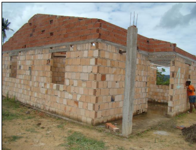
Foto 1: Unidade habitacional Girau Grande – logo após paralisação do Projeto.