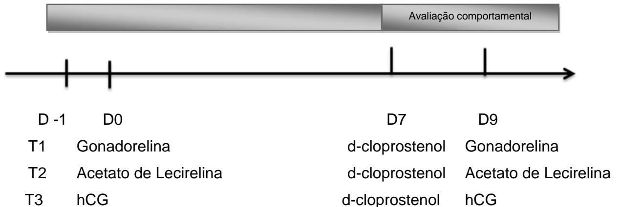
Figura 1- Protocolos Cosynch utilizados e intervalos das avaliações ultrassonográficas realizadas nos tratamentos experimentais.