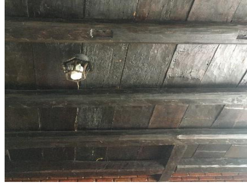
Figura 20 - Barrotes que sustentam o piso superior