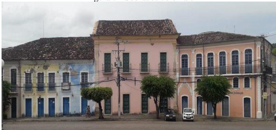
Figura 7 - Sobrados coloniais