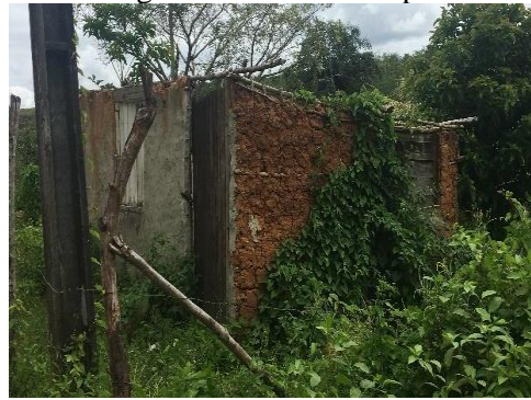
Figura 22 - Casa de taipa