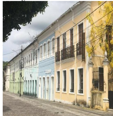
Figura 6 - Sobrados coloniais