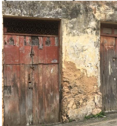
Figura 15 - Parede com argamassa de barro