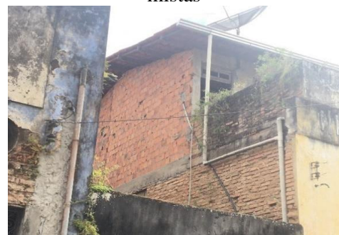
Figura 24 - Casa reformada com técnicas mistas