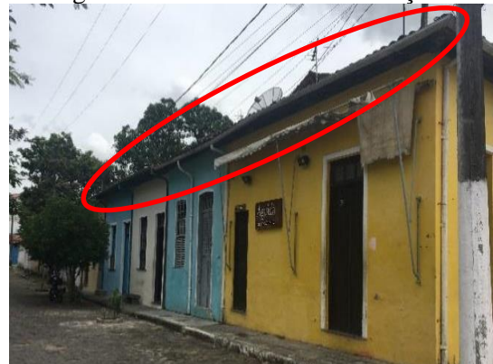
Figura 17 - Beirais com modificações