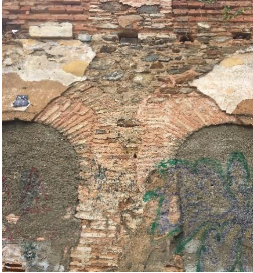
Figura 12 - Parede em estrutura mista

A execução de estruturas mistas (Figuras 12 e 13) com vistas a baratear as construções, sem eventualmente comprometer a resistência das mesmas era também um tipo de construção bastante comum em Cachoeira.