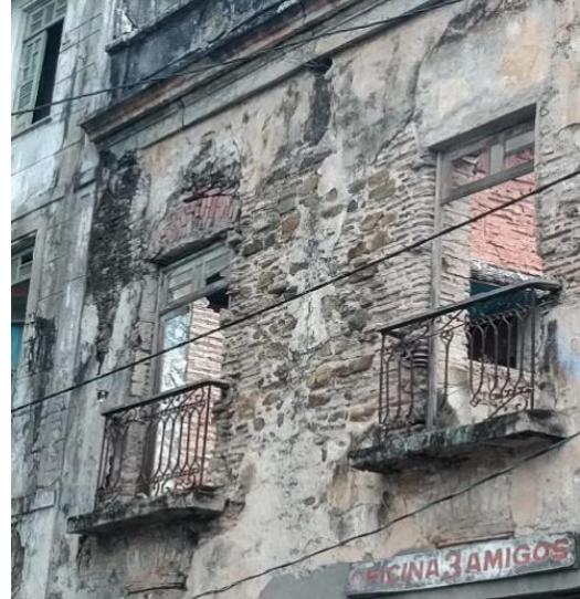
Figura 13 - Parede em estrutura mista