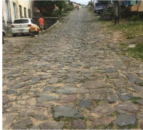
Figura 9 - Ruas com calçamento em pedras