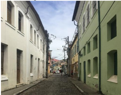
Figura 2 - Rua corredor

sobrado. Não se concebiam casas recuadas e com jardins, ademais, as edificações eram alinhadas pela divisa frontal e geminadas nos dois lados, usando todo o limite lateral do terreno, criando a chamada rua corredor (Figuras 2, 3 e 4). As ruas eram uniformes e as residências quase sempre construídas alinhadas às vias públicas.