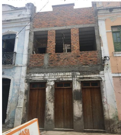
Figura 25 - Casa em reforma, mantendo fachada colonial

Observa-se que nas casas que passaram ou estão passando por reforma, principalmente na área central, há uma preocupação, até por obrigação, em manter a identidade visual colonial histórica, sobretudo nas fachadas dos prédios do centro urbano do município, apesar de promoverem modificações drásticas na estrutura interna dessas edificações (Figura 25).