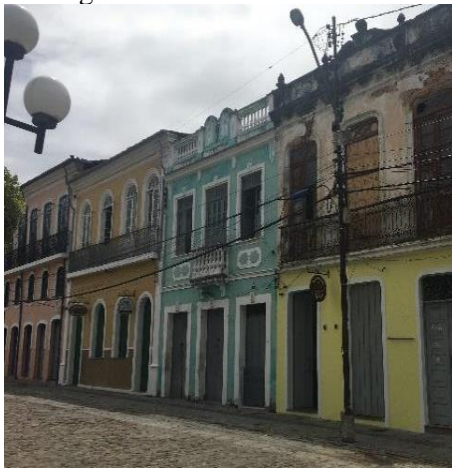
Figura 5 - Sobrados coloniais

Nesse aspecto, observa-se que Cachoeira apresenta características construtivas particulares e expressivas. Duas peculiaridades bem representativas são: o uso da pedra, elemento comum nas cidades litorâneas, vastamente utilizado como material de construção, e a predominância de casas urbanas em formato de sobrados coloniais (Figuras 5, 6 e 7) por força da influência arquitetônica portuguesa.