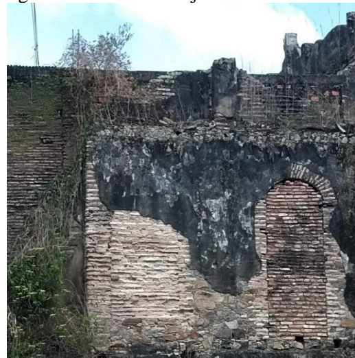
Figura 11 - Parede de tijolos de barro cozido