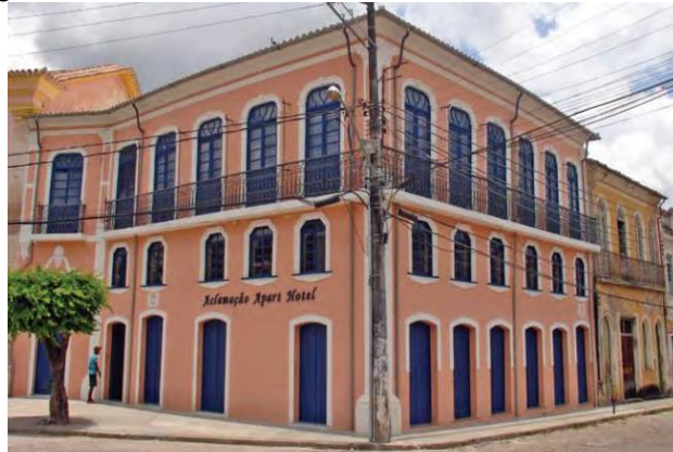
Figura 18 - Sobrado Colonial com influências neoclássicas