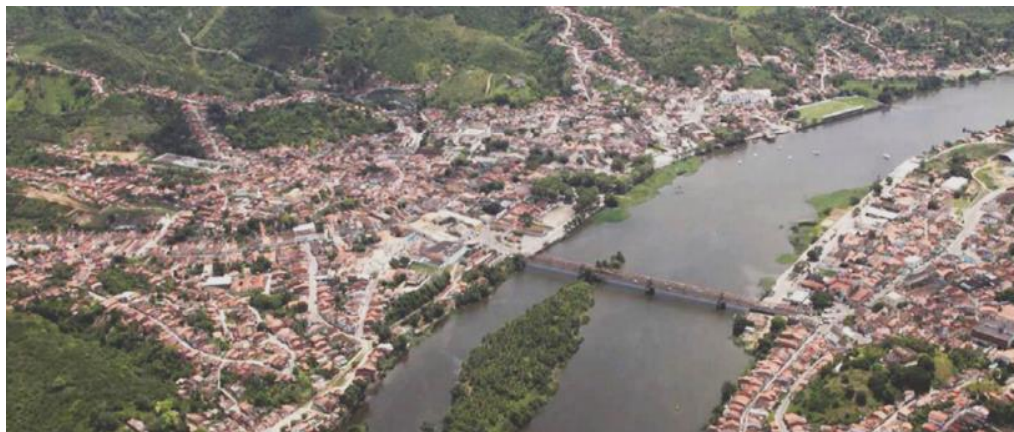
Figura 1 - Visão panorâmica da cidade de Cachoeira (à esquerda).