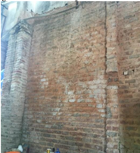
Figura 10 - Parede de tijolos de barro cozido

Outro material bastante difundido foi o tijolo de barro cozido (Figuras 10 e 11), por possuir uma maior resistência à umidade e, conseqüentemente, às inundações, que eram bastante comuns no município, além de possibilitar a realização de detalhes estéticos, como ornamentos, arcos, entre outros, e viabilizar a execução de um maior número de aberturas na alvenaria, como janelas e portas. A maior facilidade de assentamento dos tijolos de barro cozido, permitiam a execução de vergas curvas, permitindo a execução de esquadrias em arcos plenos ou abatidos.