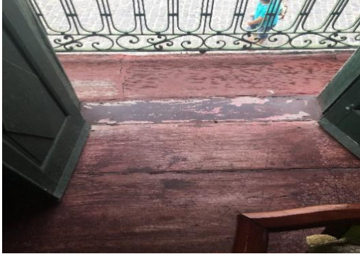
Figura 19 - Piso de madeira em tábua corrida no pavimento superior