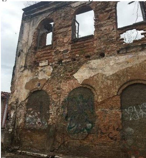
Figura 14 - Parede com argamassa em barro

O solo predominantemente argiloso facilitou a utilização do barro como um dos principais materiais construtivos, estando sempre presente, entre outras formas, como componente das argamassas (Figuras 14 e 15) de assentamento ou reboco, de fácil percepção pelo aspecto da coloração.