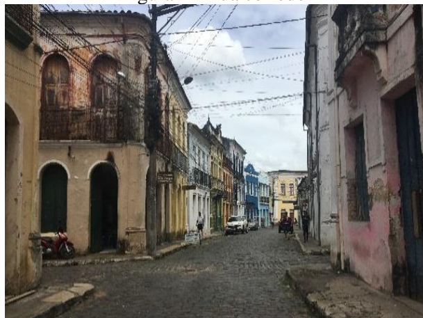
Figura 4 - Rua corredor