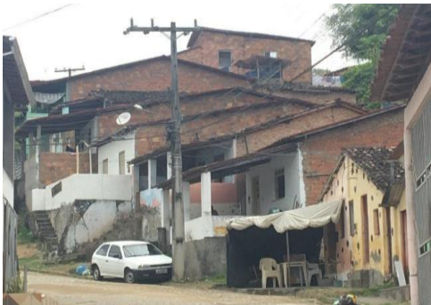
Figura 23 - Construções recentes, em bairros afastados

As casas que utilizam sistemas e materiais construtivos mais atuais no município se encontram, em sua grande maioria, em bairros mais afastados do centro (Figura 23) e muitas vezes não utilizam esses sistemas modernos nas construções inteiras, são edificações recentes e simples, normalmente de alvenaria sem reboco. Ainda, é comum encontrar tecnologias construtivas contemporâneas misturadas com elementos usados no período colonial, em casas que sofreram reformas ou acréscimos (Figura 24).