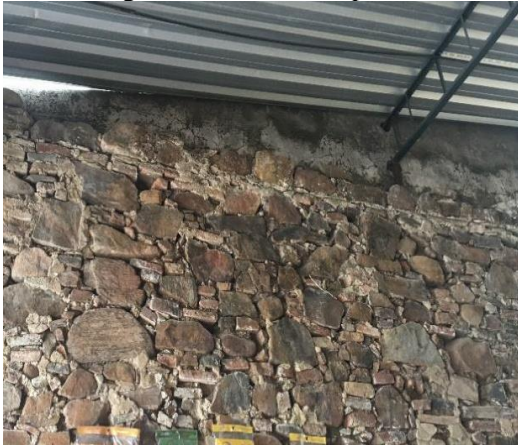
Figura 8 - Parede em pedras