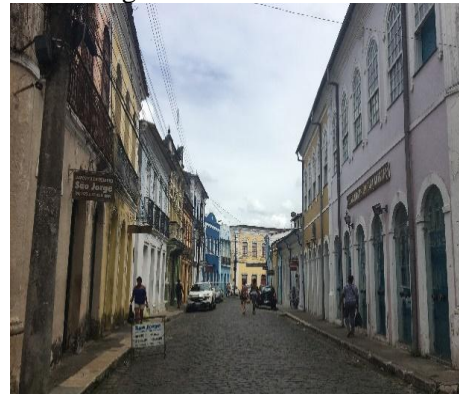
Figura 3 - Rua corredor