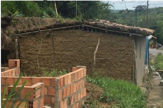
Figura 21 - Casa de taipa

São poucos os exemplares de casas de taipa (Figuras 21 e 22) que ainda podem ser encontrados na região urbana da cidade, pouquíssimas resistiram ao tempo. Atualmente, apresentam-se geralmente como anexos, como paredes divisórias, em banheiros externos das casas ou em regiões rurais ou periféricas, quase sempre abandonadas. As construções mais simples utilizavam o sistema de taipa de mão, que, segundo Colin (2010), possuíam estrutura mestra de peças de madeira e o preenchimento, em barro, jogado e apertado com as mãos.