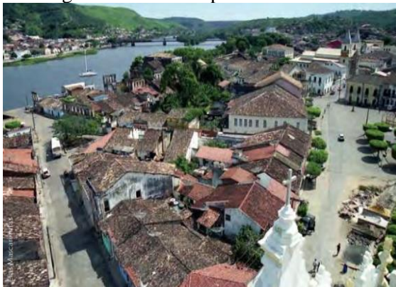
Figura 16 - Vista superior de telhados

Os telhados (Figura 16) eram pensados para evitar a infiltração de águas nas paredes, com soluções, comumente, em duas águas, que lançavam uma parte da água da chuva recebida sobre a rua e outra parte sobre o quintal. Estas coberturas apresentavam, também, a ampla utilização de beirais, prolongamento dos telhados um pouco além das paredes externas das edificações. Tais elementos eram de suma importância para a conservação das construções, contribuindo para manter a água, que escorria dos telhados, afastada das paredes (CARVALHO; NOBREGA; SÁ, 2000). Quanto à estrutura destes telhados, eram simples, de madeira, nem sempre compostas por tesouras, e sobrepostas por telhas coloniais ou de capa e canal. Atualmente, os beirais (Figura 17) persistem, mas com modificações e acréscimos de estruturas para condução da água da chuva, como calhas.