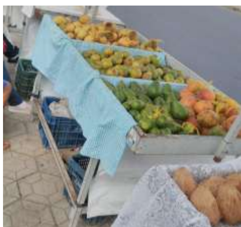
Figura 3. Produtos negociados na feira itinerante de Cruz das Almas – BA, 2019: Abacates, mangas, laranjas e