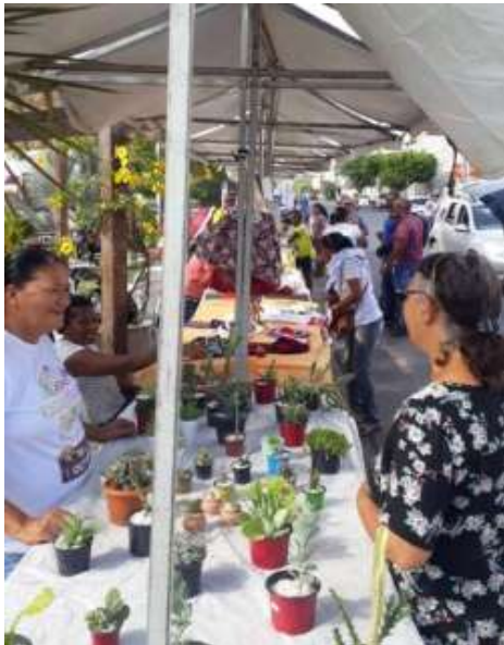
Figura 1. Feirantes e clientes na barracade plantas ornamentais na feira itinerante de Cruz das Almas - BA, 2019.