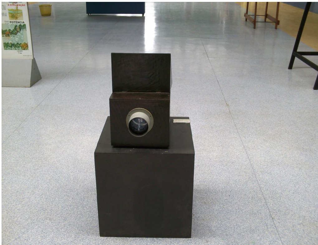
Câmara escura

importantes invenções ocorridas na sociedade do século XIX, este experimento é constituído por uma caixa de madeira, com uma pequena abertura cuja função é permitir a entrada da luz de uma parte da cena, que é projetada numa placa de vidro e nesse instante é possível visualizar a imagem refletida. O visitante que possui inclinações para essa inteligência tende a buscar a melhor imagem do seu campo visual, no que diz respeito a seu ajuste visual e ao espaço explorado. Esses posicionamentos puderam ser avaliados a partir dos conceitos trabalhados por Gardner (1998), que afirmam que a inteligência espacial consiste na capacidade de processar informações visuais no espaço além de poder transformar ou recriar tais informações.