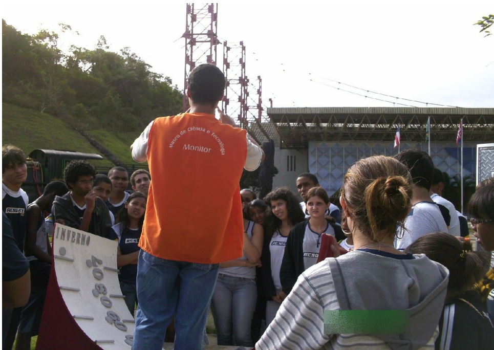
Praça da Descoberta

O museu possui uma sala intitulada como Professor Sérgio Esperidião, neste espaço o público aprende com diversão e observa fenômenos incríveis ligados à física, o que possibilita ao mesmo uma interação com diversos equipamentos entre eles o Caleidoscópio, Bicicleta geradora, entre outros.