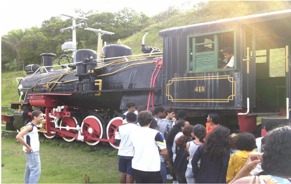
Locomotiva maria fumaça

Cabe aqui comentar, que para tal acesso na locomotiva o visitante teve que exercer com o próprio corpo movimentos flexíveis e contornados além do equilíbrio, elemento importante no uso desta inteligência. Assim como os outros experimentos mencionados, este evidencia o desenvolvimento da inteligência corporal-cinestésica para resolver determinadas questões. Os demais experimentos mencionados serão descritos com suas respectivas fotografias no anexo do presente trabalho.