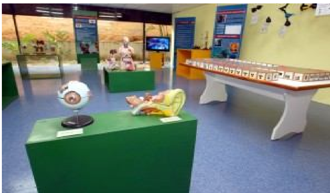
Sala de Ciência

A Sala de Ciência é um local onde contém peças da Coleção de Biologia Humana do Prof. Adelmiro Brochado. O acervo é constituído por peças que retratam órgãos humanos, que permitem aulas expositivas ao público. Ainda na mesma sala, pode-se encontrar um material de Química, que está representado por uma grande tabela periódica, moléculas construídas com garrafas PET e uma torre de destilados de petróleo.