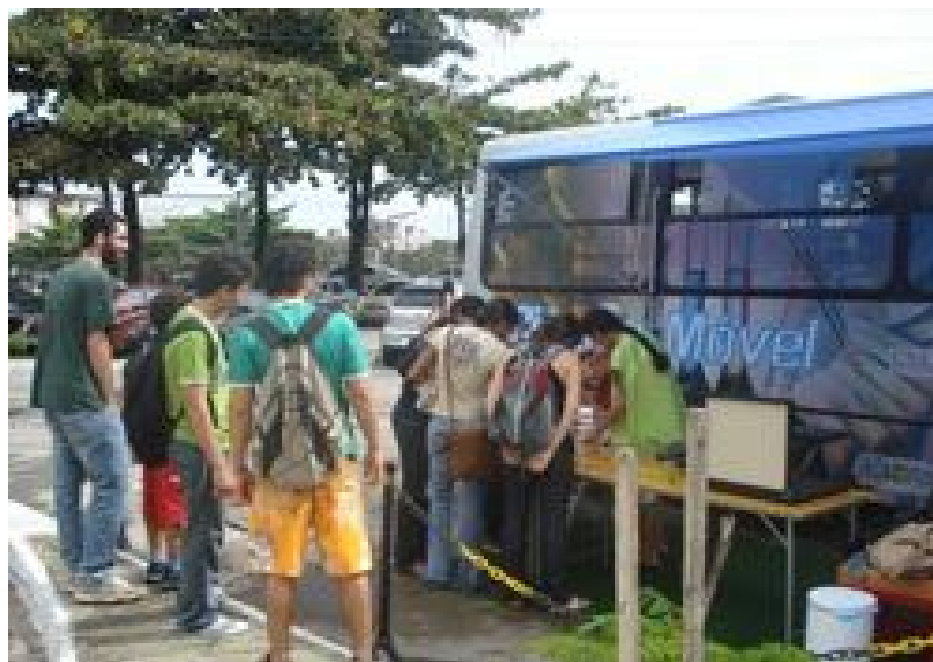
Ciência Móvel – Foto: Site do MC&T da UNEB

Esta é uma das ações que atraem diferentes perfis de público, entre eles universitários e em especial o escolar, esta instituição promove a inclusão social, por meio da educação cultural e científica. Está aberta a todo segmento de público de forma gratuita. Tal projeto percorre diversas cidades do interior da Bahia, o que reforça ainda mais seu caráter social educativo, por explorar novos territórios e divulgar a ciência e seus avanços tecnológicos para a população baiana.