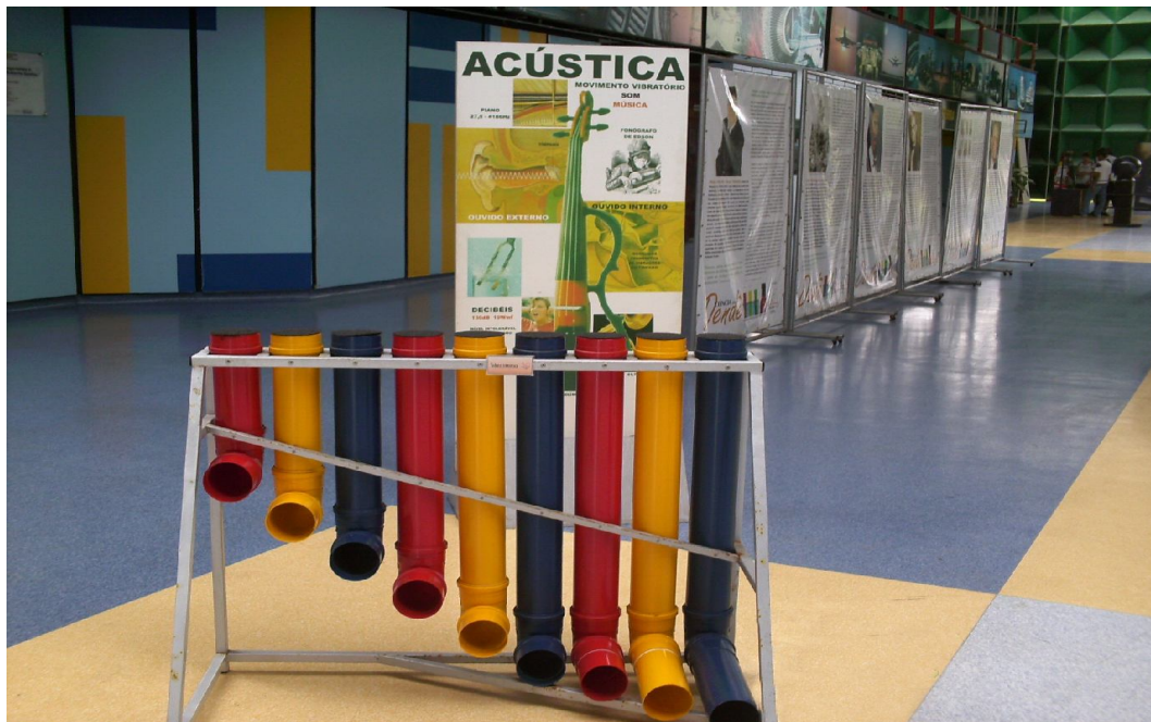
Tubos sonoros

Em todas as observações assistidas foi unanimidade a liberdade dos visitantes em bater com as mãos nos tubos, assim como foi unânime a constatação de que cada tubo produzia sons diferenciados (percepção auditiva). Foi observado também que alguns indivíduos interagiram com o acervo de modo a produzir sons que possuíam intencionalidade de melodias e ritmos. Já outros não. Foram observados também indivíduos que produziam ritmos e cantavam ao mesmo tempo. Este contato manual direto com os tubos e esta habilidade auditiva de percepção, em diferenciar e produzir ritmos e timbres que caracterizam a inteligência musical.