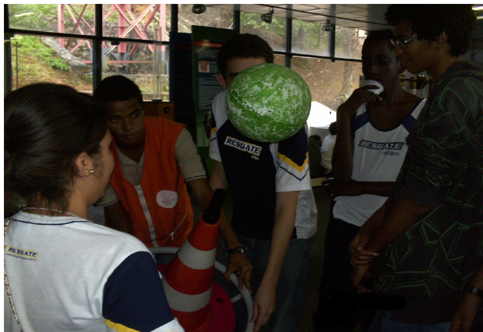
Cone de ar

O que faz analisar, que tal experimento além de permitir que o indivíduo venha a desenvolver a inteligência corporal-cinestésica, o mesmo deve ter inclinações com a inteligência espacial. Pois para tal experimento este deve ter noção do espaço que ele esta inserido, para que o mesmo movimente o cone de ar da forma que ele desejar.