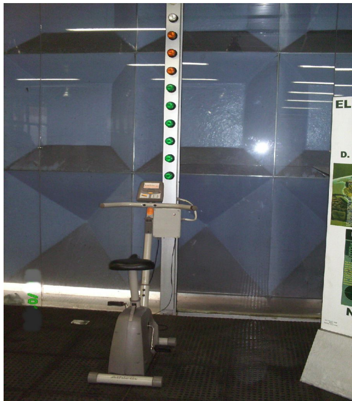
Bicicleta Geradora de Energia

Tal experimento mostra que o uso do corpo para gerar o produto que neste caso foi a energia elétrica compreendido em ascender as lâmpadas, mostra a inclinação para inteligência corporal-cinestésica, esta claramente vista quando o visitante deve pedalar para construir tal efeito.