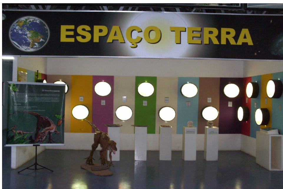
Espaço Terra

O Espaço Terra é mais um local que possui painéis descritivos das fases geológicas da superfície terrestre, destinado ao nosso Planeta. A instituição possui ainda a exposição permanente da Agência Espacial Brasileira (AEB), com painéis e maquetes de foguetes brasileiros, selo, envelope, moeda e insígnias de roupa espacial do primeiro astronauta brasileiro e um planetário. Toda a temática está voltada para o Programa Espacial Brasileiro e a Missão Centenário – do 14 Bis Marcos César Pontes.