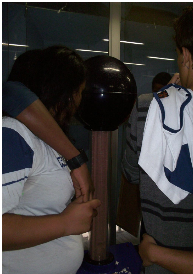
Gerador de Van Der Graff

Existiram em todas as situações, potenciais inclinações intelectuais para realização de tal experimento. Isto não ocorreu de maneira mais dinâmica, pela seguinte razão: medo de manusear, como pode ser observado no Gerador de Van Der Graff. Este aparelho gera um campo de intensa tensão eletrostática, foi observado com isso que o visitante que aceitou tocar no experimento por 5 minutos, ficou com os fios de cabelos em pé, o que proporcionou aos demais, indagações e admiração. Este foi um experimento que gerou bastante polêmica, pois 90% dos visitantes tinham medo de manusear e os outros 10% despertaram relevante interesse em interagir com tal acervo. Mesmo depois de realizado tal experimento, os visitantes que estavam com medo em interagir não mudaram a sua opinião.