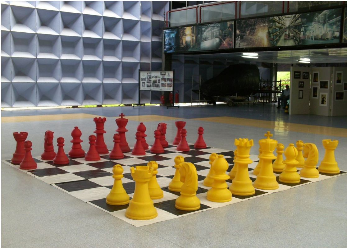
Jogo de Xadrez

inclinação intelectual, que é a lógico-matemática. Foi observado que a visão que o indivíduo possui de todo o tabuleiro exige do mesmo, não somente uma análise do espaço e das peças dos quais ele irá explorar, mas o raciocínio lógico de qual jogada ele deve fazer para que o seu adversário não venha levar vantagem em relação a ele. Ou seja, o indivíduo deve projetar previamente no seu intelecto, cada ação que será efetuada na partida.