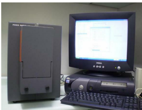
Figura 2: Leitura no espectrofotometro NIR

O rendimento depurado de cada árvore do experimento foi estimado com utilização do NIR, realizado no Laboratório de Melhoramento Genético Florestal da Universidade Federal de Lavras - MG.