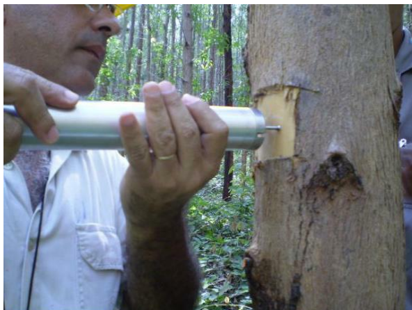
Figura 1: Mensuração da densidade básica