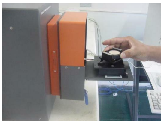
Figura 5: Leitura da amostra no NIR

Após 24h de armazenamento, a madeira moída foi compactada manualmente na unidade de leitura do espectrofotômetro ( spinning ), e assim, foram coletados os espectros NIR de cada amostra, em duplicata. A leitura dos espectros foi feita em um equipamento NirSystem 5000 da Foss (acoplado ao software WinISI) (Figura 5), composto por uma fonte luminosa, um monocromador, com seletor de comprimentos de onda do tipo de grupos funcionais orgânicos, uma rede de difração, um receptáculo para amostras, um fotodetector e um computador, onde são armazenados os espectros (Figura 6). De acordo com Nisgoski (2005), o aparelho faz 32 varreduras por leitura e o espectrofotômetro envia o valor médio de \log(1/R) para o computador, gerando assim um espectro.