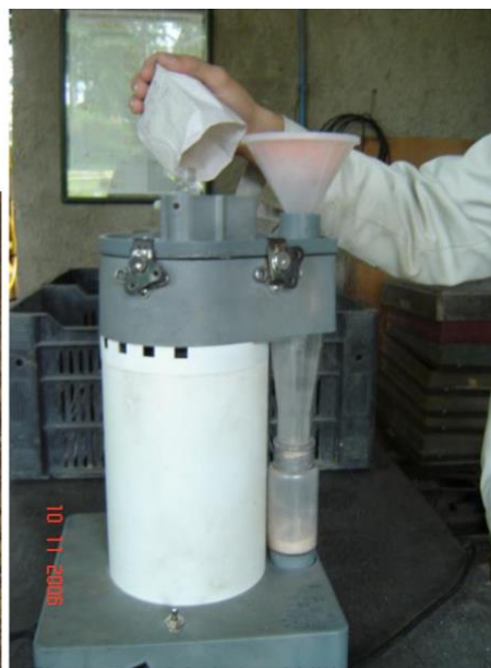
Figura 4: Moinho Willey

Após 24h de armazenamento, a madeira moída foi compactada manualmente na unidade de leitura do espectrofotômetro ( spinning ), e assim, foram coletados os espectros NIR de cada amostra, em duplicata. A leitura dos espectros foi feita em um equipamento NirSystem 5000 da Foss (acoplado ao software WinISI) (Figura 5), composto por uma fonte luminosa, um monocromador, com seletor de comprimentos de onda do tipo de grupos funcionais orgânicos, uma rede de difração, um receptáculo para amostras, um fotodetector e um computador, onde são armazenados os espectros (Figura 6). De acordo com Nisgoski (2005), o aparelho faz 32 varreduras por leitura e o espectrofotômetro envia o valor médio de \log(1/R) para o computador, gerando assim um espectro.