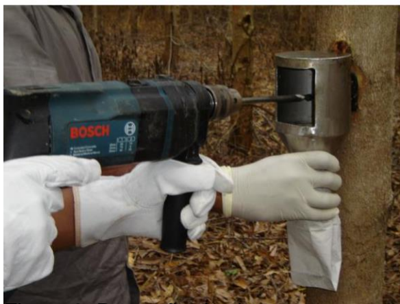
Figura 3: Remoção das baguetas